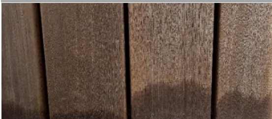
Bei Nichtbeachtung der Velegevorschriften

Alle Dielen sind an den Kopfenden mit einem Wachs (Paraffin) überzogen. Dieses dient als Transportschutz.